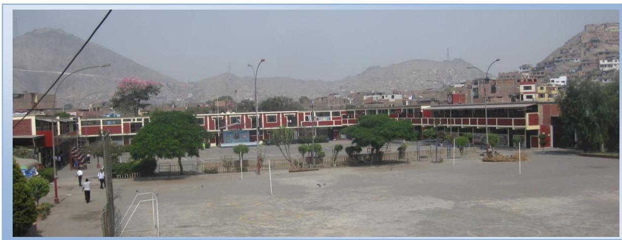
Figura 2. Patio de la Institución Educativa Fe y Alegría No.5.

Dentro de este contexto estamos insertados para ofrecer una educación de calidad.