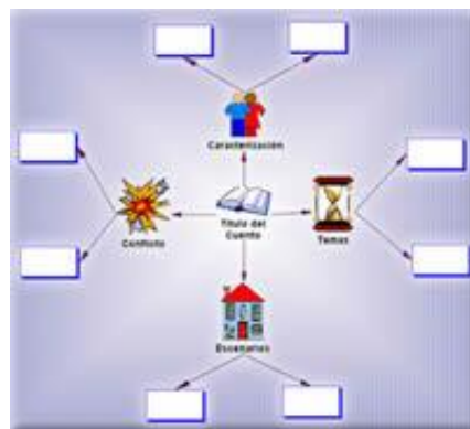
Figura 3. Organizador “Telaraña”.